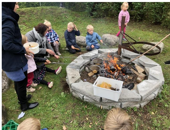
Vi kan lave mad over bål.

Om sommeren går vi på insektjagt, og bruger forundringsduge til at bestemme hvilke insekter vi har fanget, vi har sågar sat et insekthotel op på legepladsen. Vi oplever årstidernes skiften, vi bruger vores udendørshytte om efteråret og vinteren, hvor vi tænder op i brændeovnen og laver aktiviteter med børnene i hytten. Når efteråret og høstfesten er afholdt, får børnene lov at beholde halmballerne på legepladsen til at lege med, bygge huler osv.