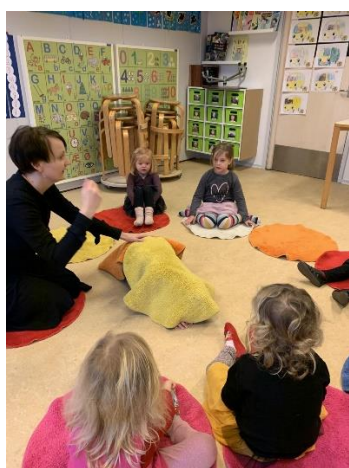
LUN som gruppeleg

Metoden er udviklet med udgangspunkt i tilknytningsteorien, og bidrager til at styrke børnenes sociale kompetencer og det grundlæggende selvværd, der er så vigtigt på deres vej til at vokse op og lære sig selv at kende.