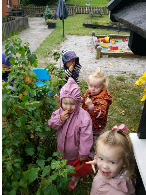
Bærbuskene bliver plukket og spist.

Vi bruger ligeledes vores nyindkøbte cykler til at besøge togstationen, kigge på køer, tage til fjerne legepladser, og få vind i håret.