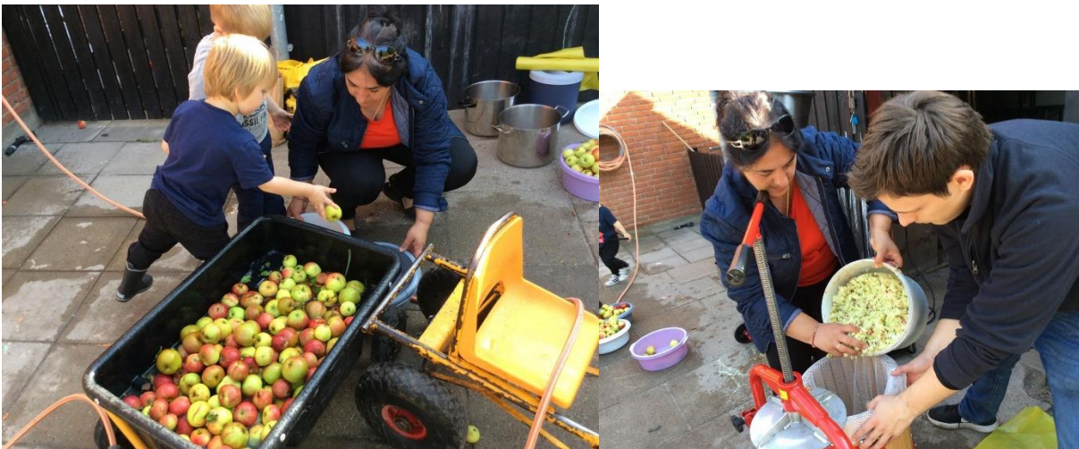
Så er der æblemost.Uhmm!

Vi plukker vores egne æbler på legepladsen, børnene er med i processen, de plukker, skyller og er med til at se de voksne lave æblerne til most, og til sidst drikker vi hjemmelavet æblemost med børnene. Vi vægter processerne med børneinddragelse højt