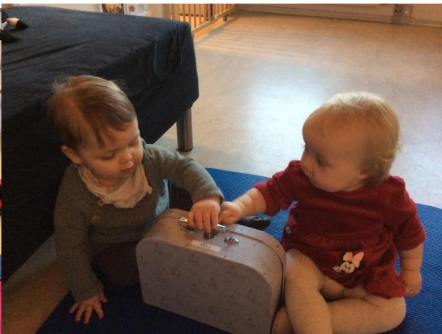
LUN med fokus på nærvær.