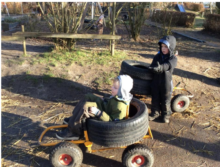
Børnene bygger mooncare'ne om med dæk.