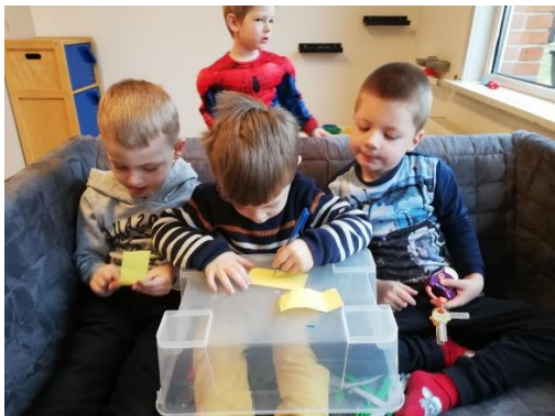
Alle får en rolle i legen

Vi inddrager børnene hvis et barn har brug for trøst ved at spørge: "Er der nogen der hjælper, eller trøster. På den måde lærer børnene at det ikke kun er voksne der kan trøste og hjælpe, men at børnene selv får lært hvordan man bliver et empatisk menneske.